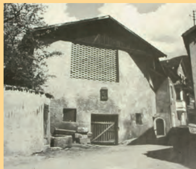
Alter Pollinger Hof in der Hagengasse 3 Aufn. 1941, Stadel abgebrochen 1957

Der Ausgangspunkt des ehemals klösterlichen Weinbaues auf dem Weingütl Pollinger Hof in Untermais/Meran ist uns Verpflichtung, die Weine ausschließlich aus diesem Anbau-gebiet zu beziehen. Dem Pollinger Hof waren seit dem 12. Jahrhundert Eigenflächen und Zehentrechte auch aus den umliegenden Gemeinden zugeordnet.